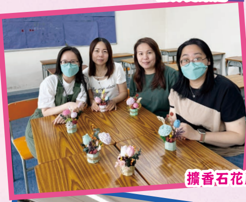
擴香石花座工作坊