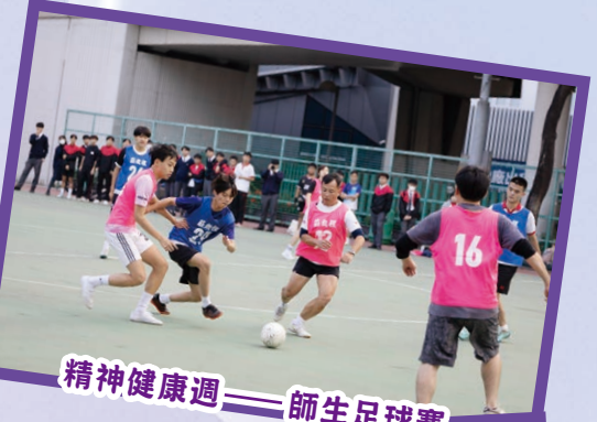
精神健康週 — 師生足球賽