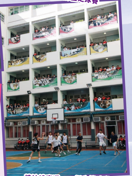
精神健康週 — 師生籃球賽