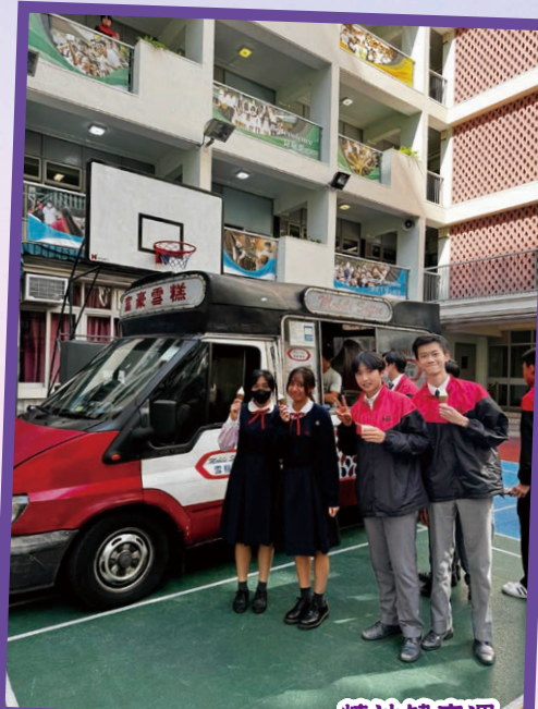
精神健康週 — 雪糕車同樂日